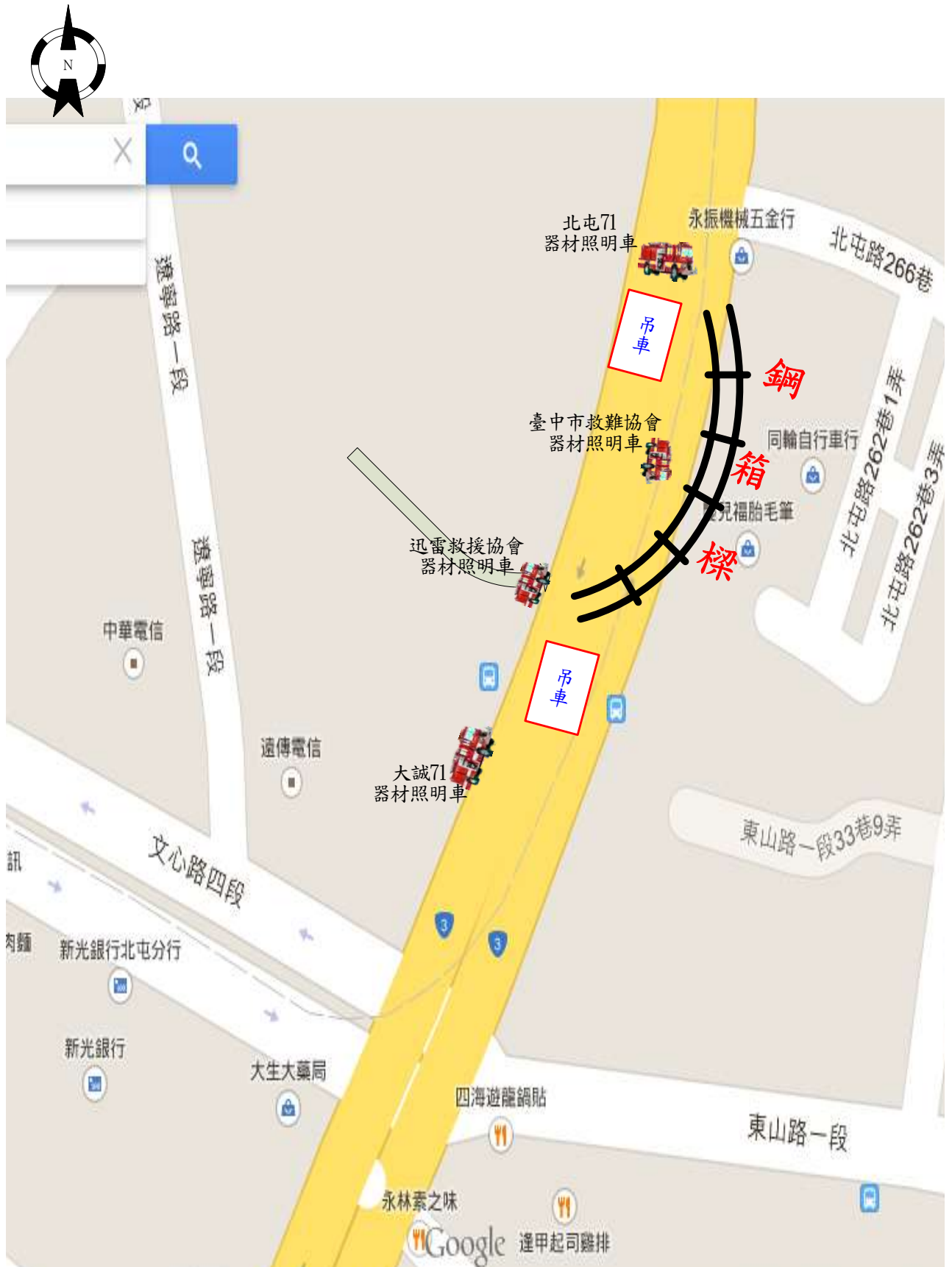
北屯區北屯路264之10號前捷運工地 夜間搶救照明佈署圖