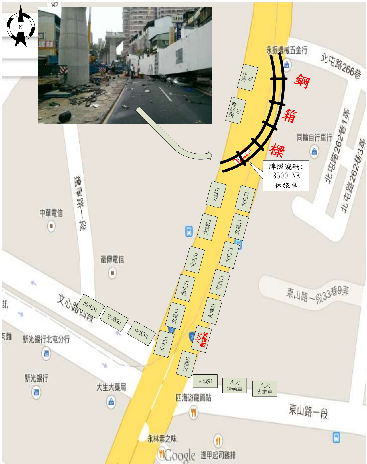
北屯區北屯路264之10號前捷運工地 初期搶救佈署圖