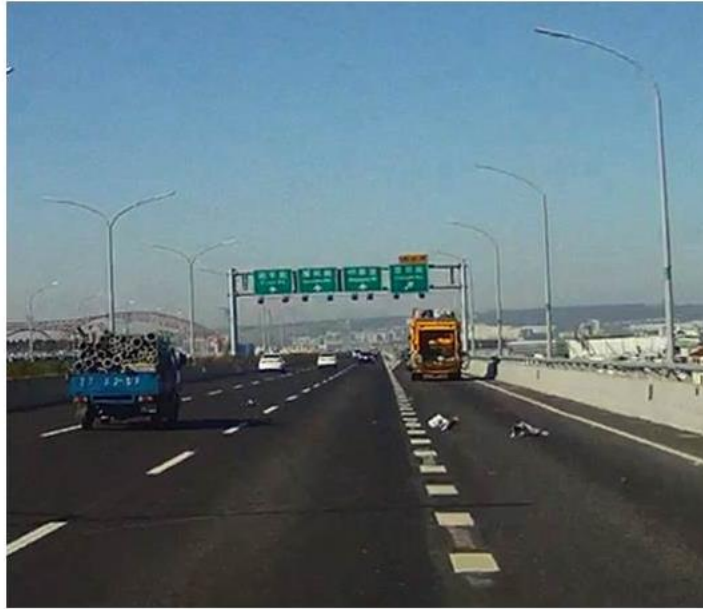
車號468-RF行經台74線霧峰往中清方向下崇德路交流道 (未將垃圾密封，附掛在外側)