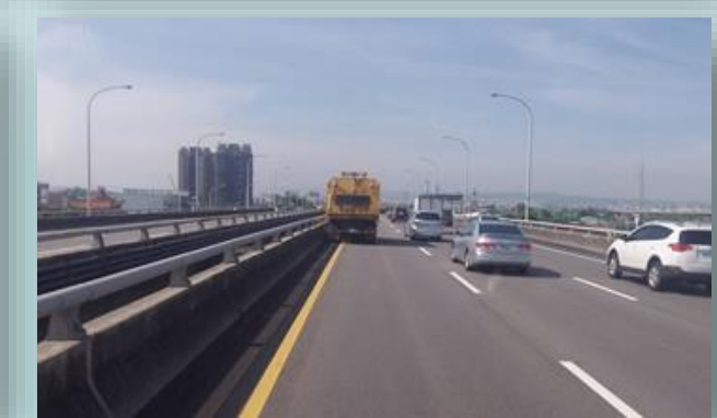
台74線路面清掃照片